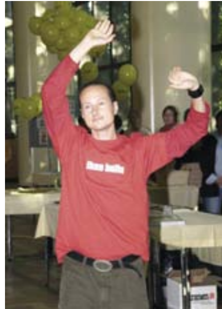
Maailman mielenterveyspäivänä 10.10. järjestettiin Helsingissä Nollatoleranssi-tapahtuma, jonka tavoitteena oli vähentää mielenterveysongelmiin liittyvää häpeää.