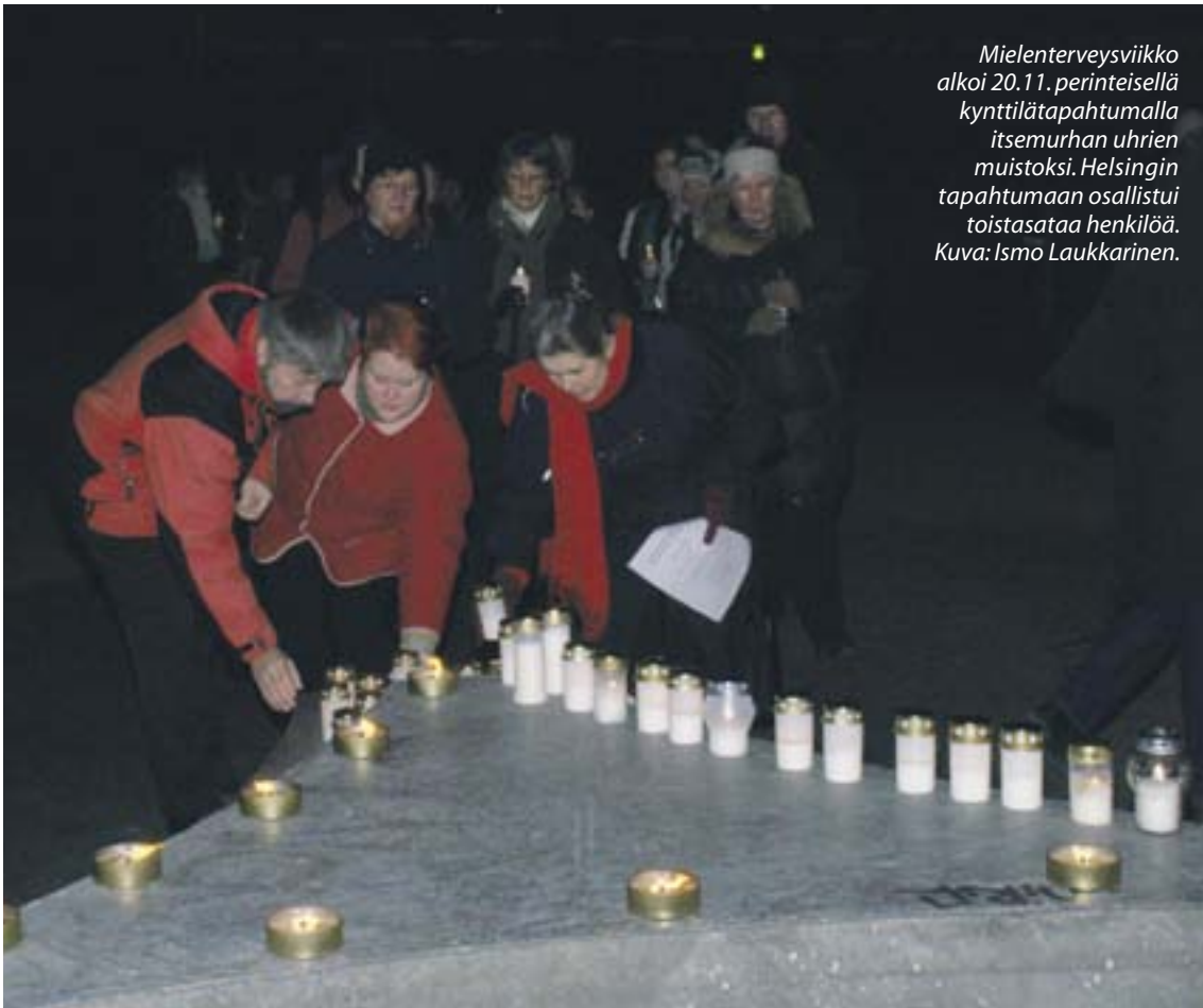
Mielenterveysviikko alkoi 20.11. perinteisellä kynttilätapahtumalla itsemurhan uhrien muistoksi. Helsingin tapahtumaan osallistui toistasataa henkilöä.