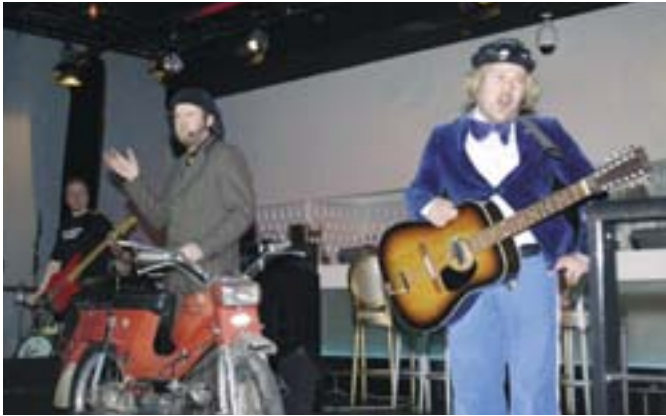
Muusikot ja stand up -koomikot järjestivät maaliskuussa viihdeillan vapaaehtoisen mielenterveystyön hyväksi. Tilaisuudessa esiintyi muun muassa Halavatun papat.