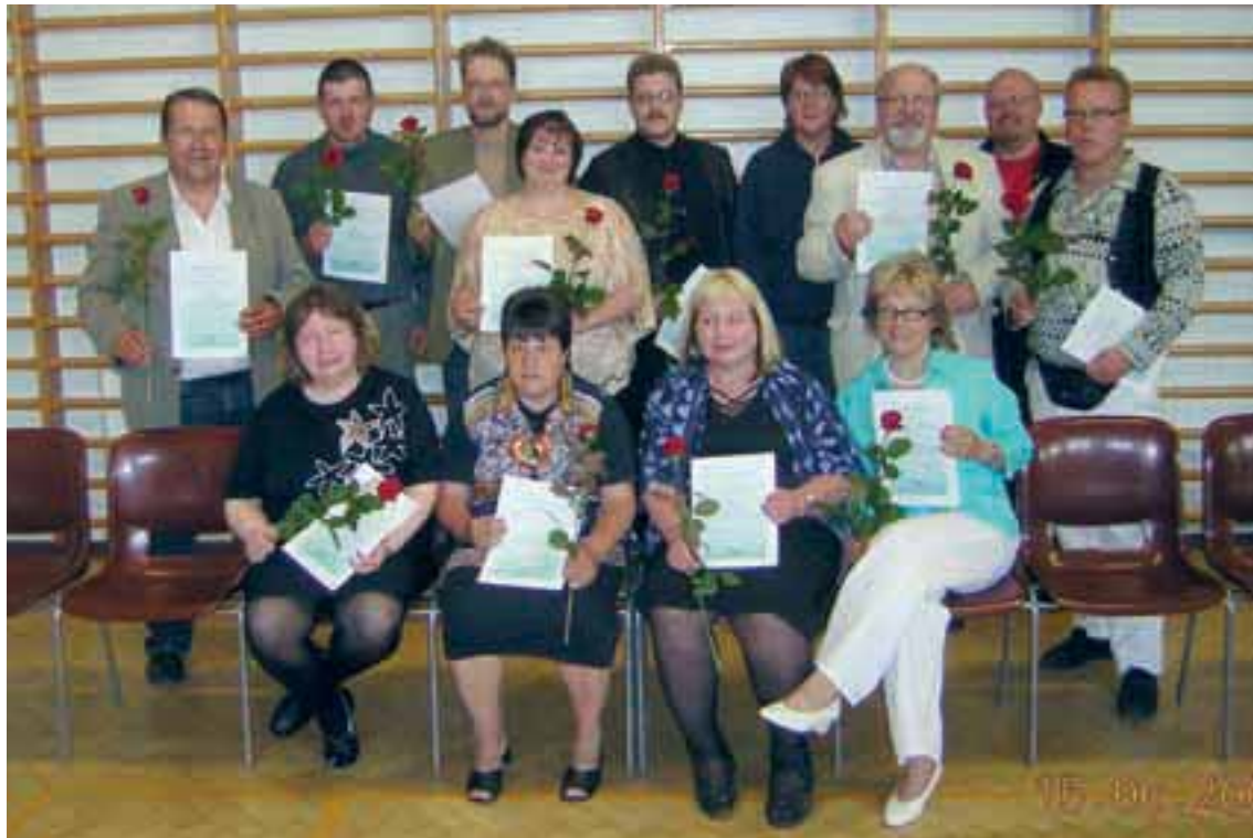
Suomen ensimmäiset kuntoutuja-tutkijat valmistuivat.

Toimintavuonna tutkittiin mielenterveyskuntoutujien asumispalvelut Joensuun ja Imatran seuduilla. Raportin viimeistely jäi vuoden 2008 puolelle.