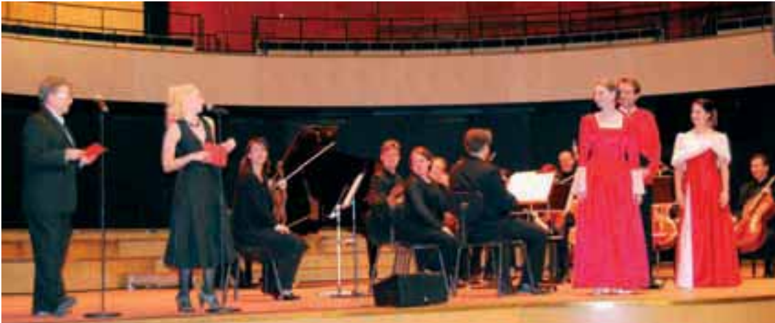
Vuosi 2007 oli kuntoutuskurssitoiminnan 25. vuosi. Neljännesvuosisadan taivalta juhlittiin Lahden Sibeliustalolla Ehjä Lapsen Mieli konsertilla.