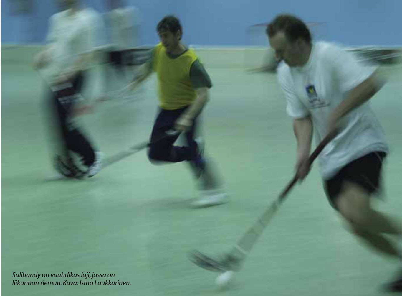
Salibandy on vauhdikas laji, jossa on liikunnan riemua.

ja fyysistä hyvinvointiaan. Liikuntavastaavia lisäkoulutettiin luontoliikuntaan, jotta he voivat järjestää toimintaa omassa paikallisyhdistyksessään. Jäsenten aktiivisuutta seurattiin luontoliikuntakorttien avulla.