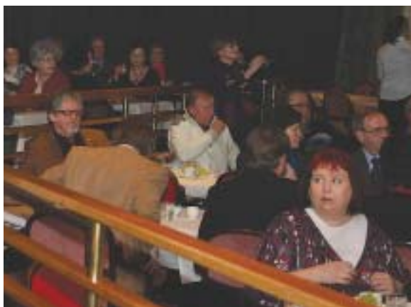
Väkeä huutokauppaan hotelli Kimmeliin tuli mukavasti.