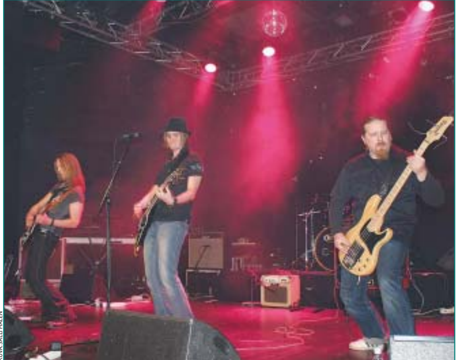
Medication keeps me going -konsertissa esiintyi myös hyväntekeväisyyskampanjan käynnistänyt Wolver-yhtye.

Holy Feather Oy on julkaissut kampanjan puitteissa kappaleesta digisinglen, jonka hinta on 1 euroa. Singleä voi ostaa Equal Dreams ja Mtv3 Store -nettikaupoista, ja sen myyntituotto lahjoitetaan lasten ja nuorten mielenterveystyöhön.