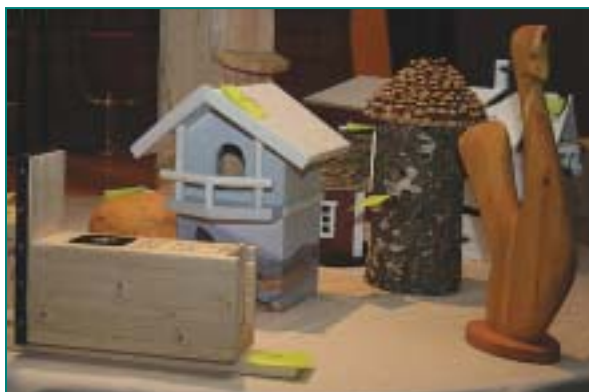
Pohjoiskarjalaisten vaikuttajien nikkaroimat omintakeiset linnunpöntöt kävivät kaupaksi.