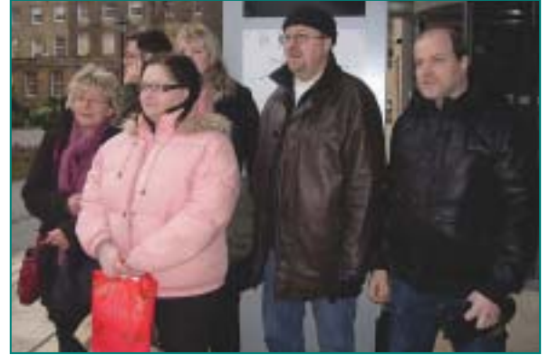
Mielenterveyden keskusliiton Kokemustutkijat kävivät tutustumassa vertaistukiammattilaisten työhön Englannissa.

Englannissa on arkipäivää vertaistukiammattilaisten palkattu työ sairaaloissa ja klinikoiden työryhmissä. Lähtövalaisuudessa vertaistukityöntekijöiden palkkaaminen mielenterveytytyöhön on myös Suomessa todellisuutta. Yhtenä tärkeänä kehityshaasteena on vertaistukityöntekijöiden ammatillinen koulutus. Englannissa koulutus on