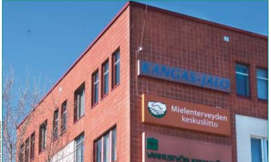
Etelä-Suomen aluekeskus toimii Helsingin Malmilla.

On ensiarvoisen tärkeää, että liiton järjestötoiminnan niukat resurssit tulevat jatkossakin jäsenyhdistysten tueksi eikä niitä hukata