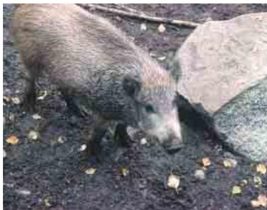
▶ Eläinpuistossa törmäsi mitä kummallisimpiin olioihin.

Retkellä Ranuan eläinpuistoon päivien osallistajat näkivät monia suomalaisen luontoon kuuluvia eläimiä. Ainoa ”vieras” oli jääkarhu, jota ei yleensä liitetä suomalaisen luontoon muuten kuin turisteja kiusattaessa.