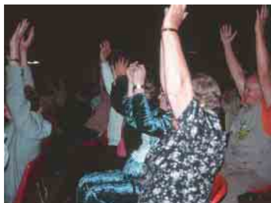
► Vanhanajan iltamissa yleisö sai liikuntaa.