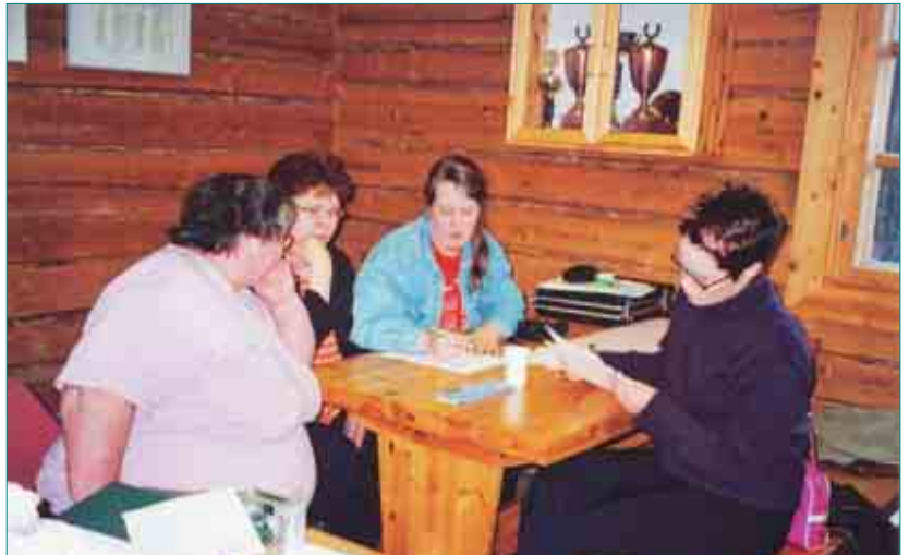
• Suopursujen hallitus kokoontui ensimmäistä kertaa perustavan kokouksen yhteydessä.

Yhdistyksen alkavan toimi- kauden ohjelmaan otettiin vas- taan ehdotuksia. Jatkossakin toivotaan jäsenten aktiivista toi- veiden esittämistä hallituksen jäsenen kautta. Hallitus tekee lopulliset ratkaisut toteutumisen suhteen, mutta ainakin syysret- kellä halutaan käydä ja saada järjestettyä kerho iltoja jo tule- valle syksylle. Toiminta pääsee varmasti kunnolla käyntiin, kun yhdistys liittyy Mielen-terveyden keskusliittoon ja Oulun Hyvän