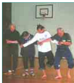
► Liikuntavastaavien ja ryhmäohjaajien kuntoutuspäivillä oli tarjolla monenlaista liikuntaa.