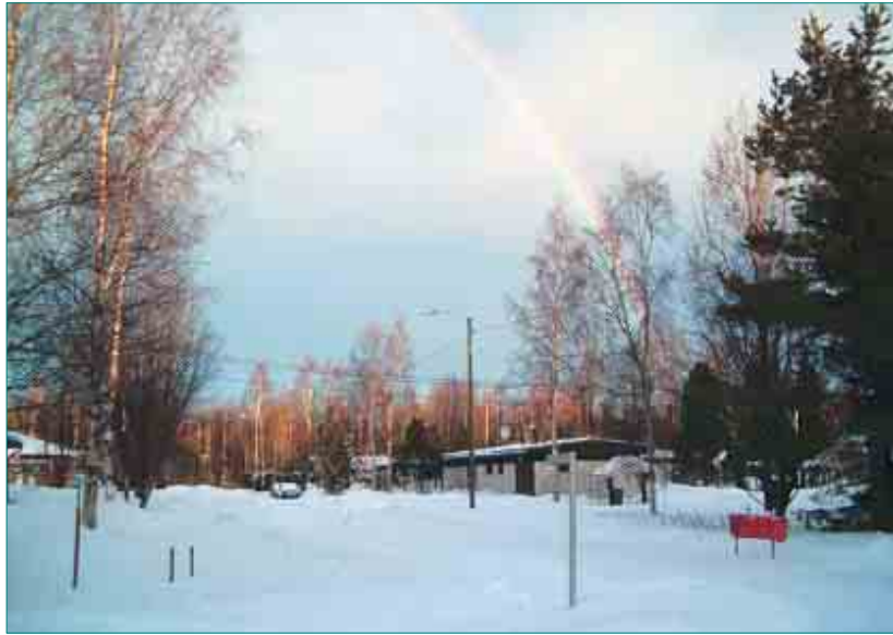
► Kotona Vihannissa tynnyrissä kasvanutta tyttöä tervehti sateenkaari.

Löydän Tolstoin Anna Kareninan, jonka äiti haluaisi lukea, mutta ei näe. Hän haluaisi täyttää sivityksessään olevan aukon 84