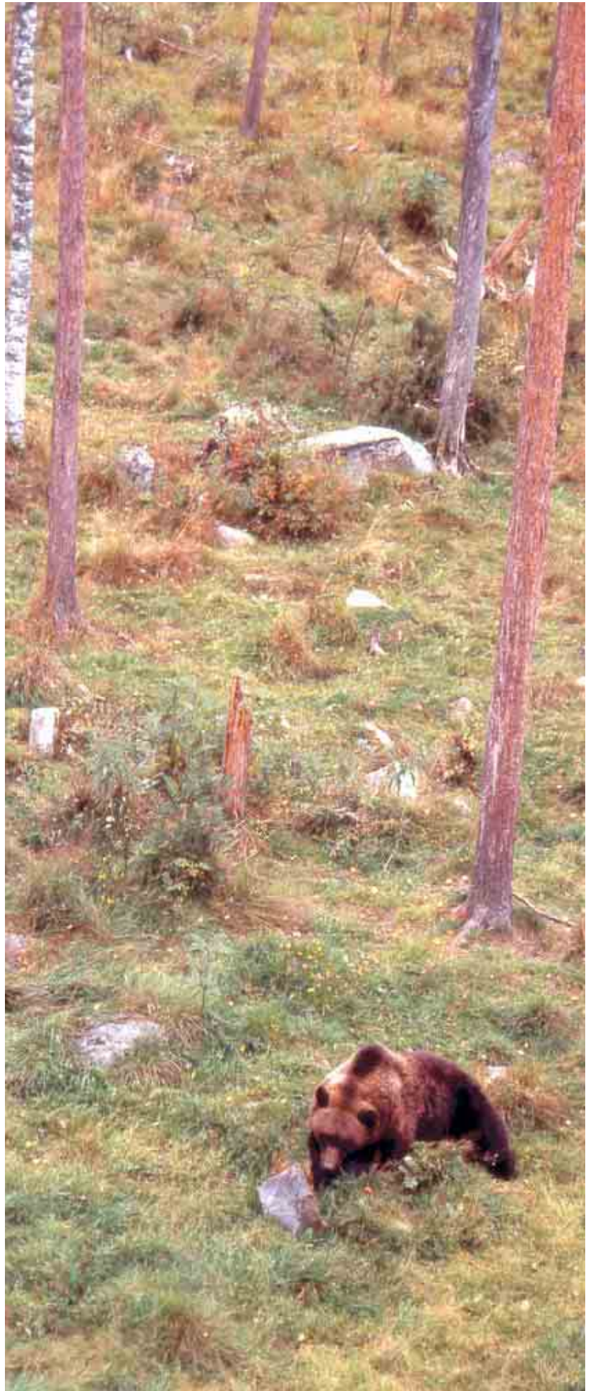
▶ Pala suomalaista luontoa on säilyttänyt Ranuan eläinpuiston.

Ruskapäivillä pidettiin myös Mielenterveyden keskusliiton liittovaltuuston kokous, jossa muun muassa hyväksyttiin alustavasti liiton toimintasuunnitelma vuodelle 2005. Lopullinen toimintasuunnitelma hyväksyttiin seuraavassa kokouksessa, kun Raha-automaattiyhdistyksen avustuspäätökset on tiedossa.