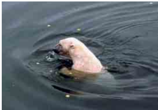
▶ Ranuan kylmänarka jääkarhu oli liian laiska maanikoksi.

Päivien ohjelmassa oli runsaasti erilaisia työpajoja ja retkiä sekä mukavaa yhdessäoloa. Työpajoja järjestettiin erikseen käsityöläisille, omaisille, tanssista ja tanssillisesta liikunnasta kiinnostuneille sekä erilaisia luovan selviytymisen keinoja etsiville.