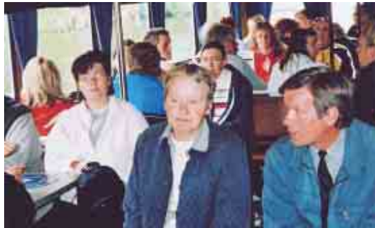
Seinäjäkelaiset pääsivät retkellään myös risteilylle sisävesilaivalla.

Laivuri sanoi: "Ja nyt tarjoamme ilmaisen kierroksen!" Kaikki käännymme katsomaan baariin päin. Minäkin ajattelin, että minä en voi käyttää alkoholia -laivuri varmasti loukkaantuu. Ja kuinka ollakkaan tämä "ilmainen kierros" osoittautui kierrokseksi ympäri järveä. Laiva siis vain pyörähti ympäri!