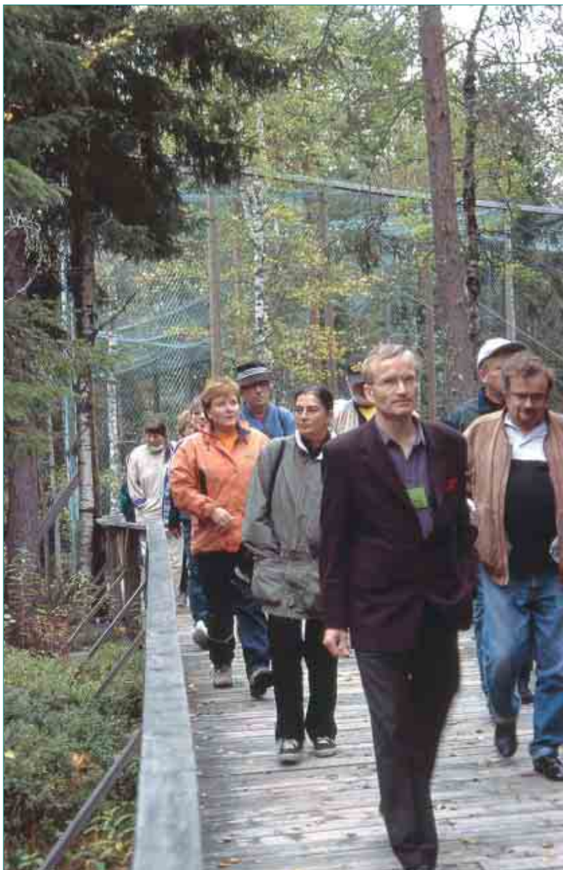
► Ruskapäivien osallistajat tutustuivat muun muassa Ranuan eläinpuistoon.

Seuraava porras oli liittymisen oma-apuryhmään. Vasta sil-