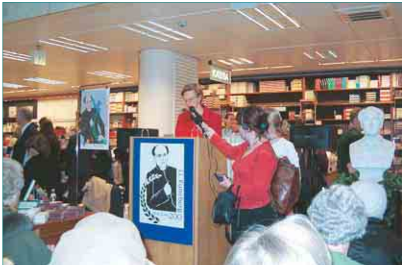
► Puhemiehen vaimo lausui runoja Akateemisessa kirjakaupassa.

Lähiainkoina aion laittaa omat kotisivut, jonne laitan kaiken keräämäni tiedon. Kirjoituksiani voin lähettää sähköpostilla halukkaille, tavalliseen postiiin minulla ei ole varaa.