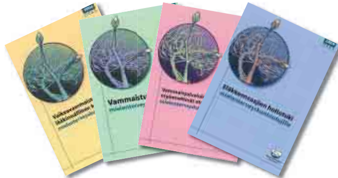
► Mielenterveyden keskusliitto on julkaissut opassarjan mielenterveyskuntoutujille kuuluvista tukimuodoista.

Edunvalvonta on ollut lähellä sydäntäni toimiessani liittovaltuustossa ja myöhemmin liiton hallituksessa. Toimin mm. liiton edunvalvontatyöryhmässä vuosia ennen siirtymistäni järjestötyöryhmän puheenjohtajaksi. Myöhemmin aloin kouluttaa itse kuntoutujia ja omaisia Tampereella ja lähikunnissa ja monet kymmenet henkilöt ovat saaneet tätä kautta joko pienimmän tai