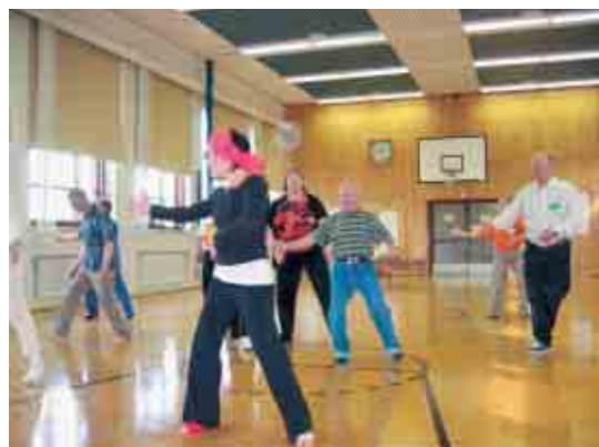
► Tanssiryhmä Hot Cakes ohjasi tanssia keskustan ala-asteella.