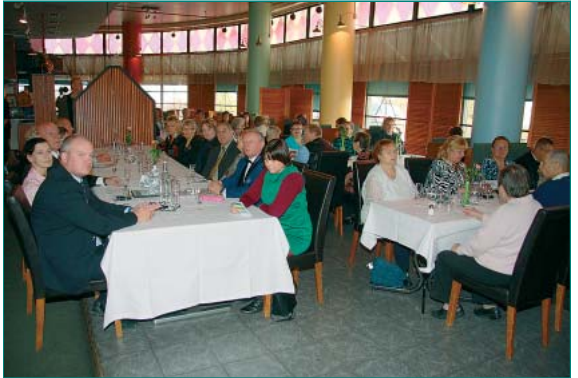
Hyvinkään Verson 40-vuotisjuhliin oli saapunut satapäinen yleisö.