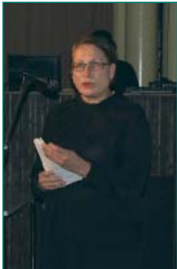
Tilaisuuden avasi kansanedustaja Riitta Myller.