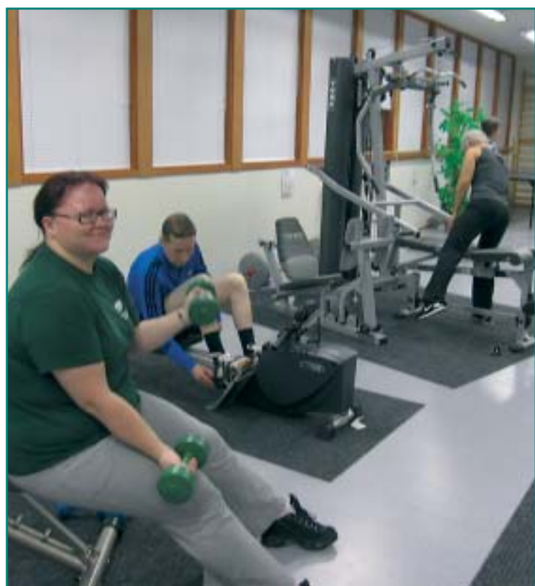
Kuntosali oli ahkerassa käytössä