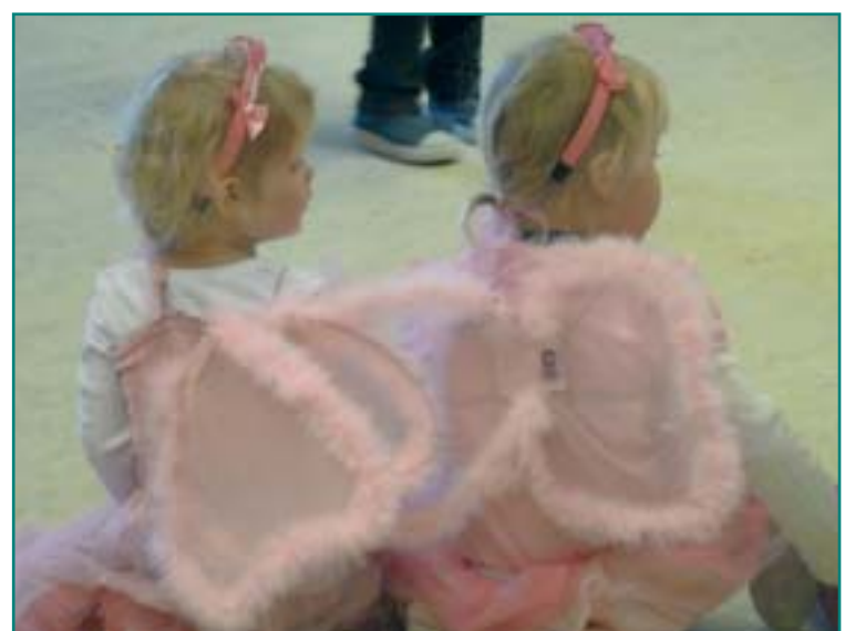
Mielenterveysviikolla on Oulussa tarjolla ohjelmaa kaikenikäisille.

Hyvän mielen talon Mielenterveysviikko päättyy lauantaina 26.11. kello 13.00–15.30 järjestettävään Karneisiin Karnevaaleihin Oulun Lyseon lukion tiloissa (Kajaaninkatu 3). Karneat Karnevaalit on