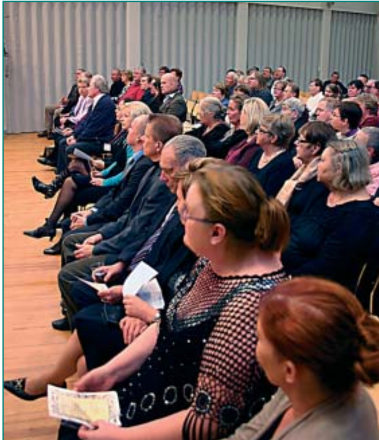
Porin juhliin oli saapunut saapunut salin täydeltä yleisöä.