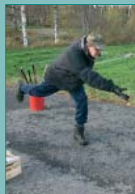
Liikuntavastaa- vien kurssilla s.12