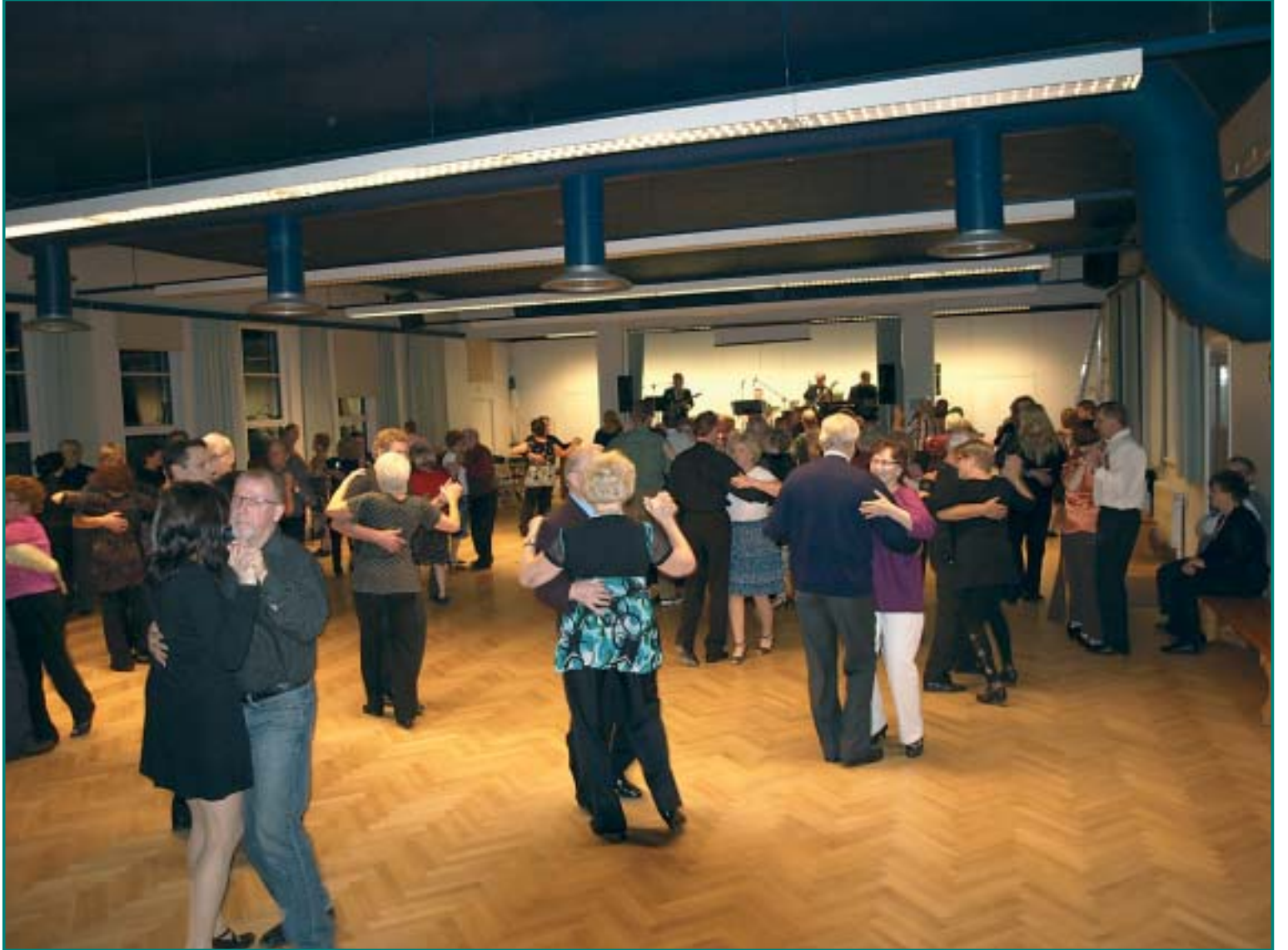
Juhlissa päästiin panemaan myös jalalla koreasti.

Ensimmäistä kertaa myönnetyn kunniamaininnan lähtökohtana on, että henkilö tulee sosiaali- ja terveysjärjestelmän ulkopuolelta. Palkinto on tarkoitus jakaa vuosittain.