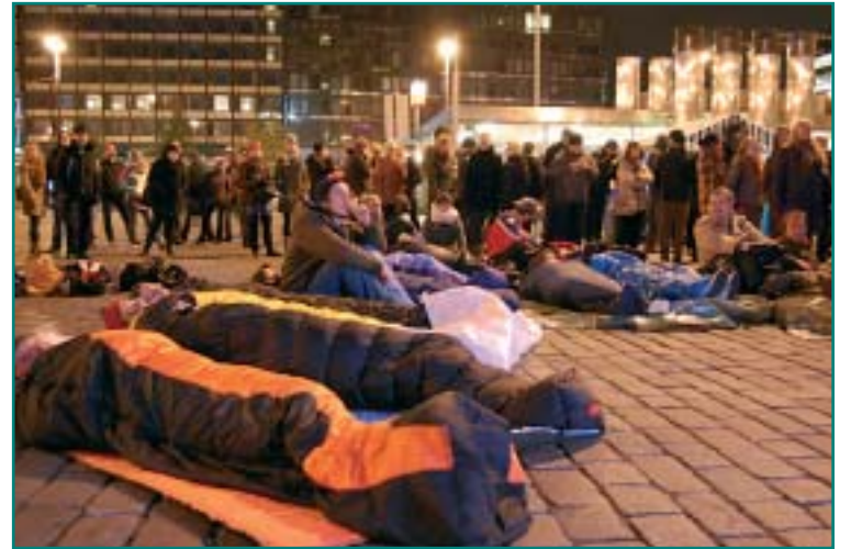
Makuupussimielenilmaus keräsi runsaasti osanottajia.