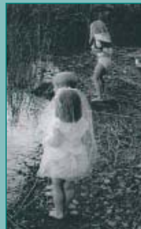
Valokuvakilpailu ratkesi s.11