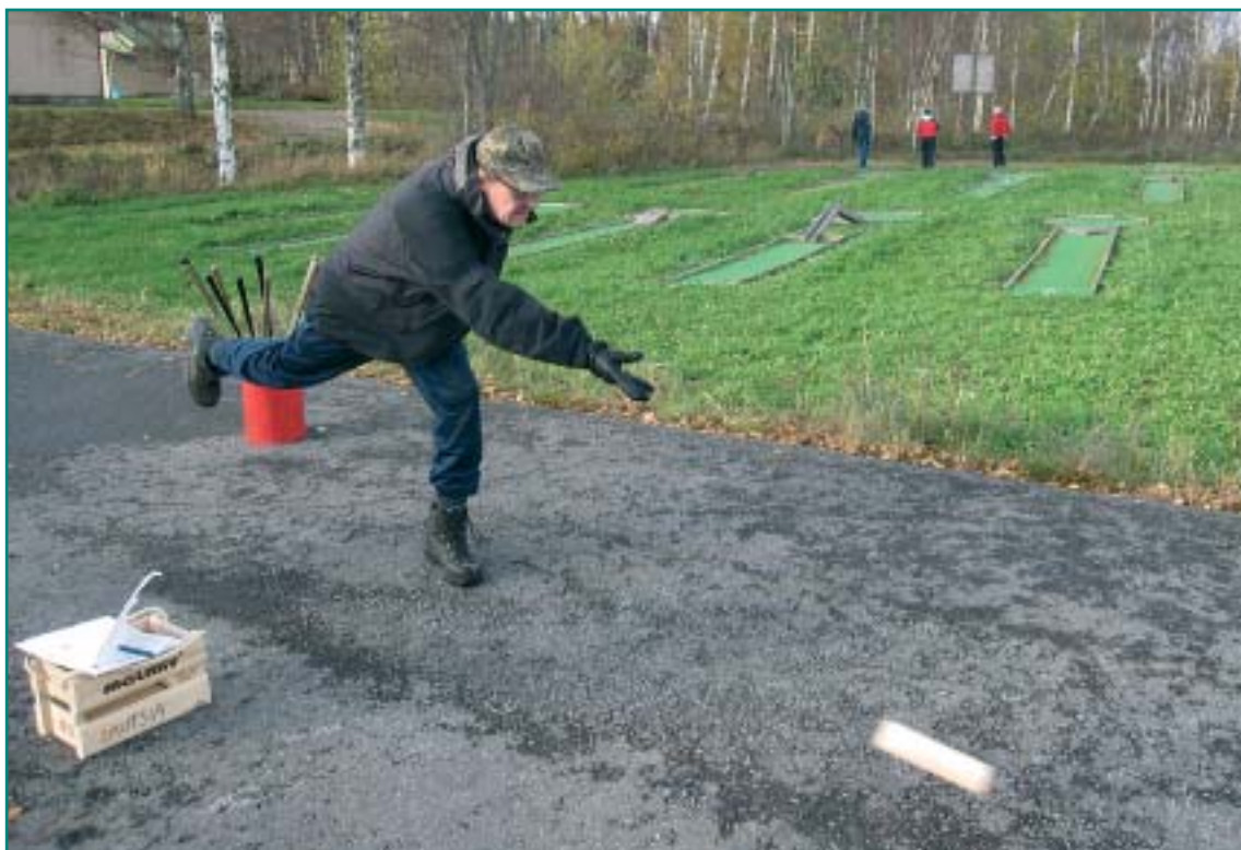
Liikuntavastaavien jatkokurssilla pääsi kokeilemaan erilaisia liikuntalajeja kuten vaikkapa Mөлkkä.

Kurssin aikana, saamiemme tietojen mukaan, allasosaston vesi oli kylmää. Luotettava pyöreä reporterimme paljastaa, että asialle on löytynyt sympaattinen selitys. Tampereen delfinaarion negatiiviset delfiinit on jouduttu evakuoimaan ja reporterimme mukaan ne ovat jo toista viikkoa majoille Lautsi-